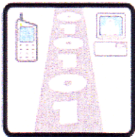
Réseaux Voix Données Images